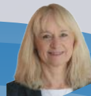
Dr. Christina Baum MdB, Mgl. im Gesundheitsausschuss, AfD