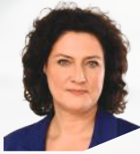
Dr. Carola Reimann

Vors. d. geschäftsf. Vorstandes, AOK-Bundesverband