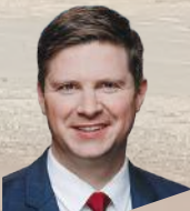
Dr. Florian Toncar

Staatssekretär, Bundesministerium der Finanzen