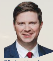
Dr. Florian Toncar

Bundesministerium für Arbeit und Soziales