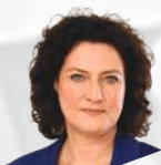
Dr. Carola Reimann

Qualitätsentwicklung für Integrierte Versorgung in Gesundheitswesen e.V.